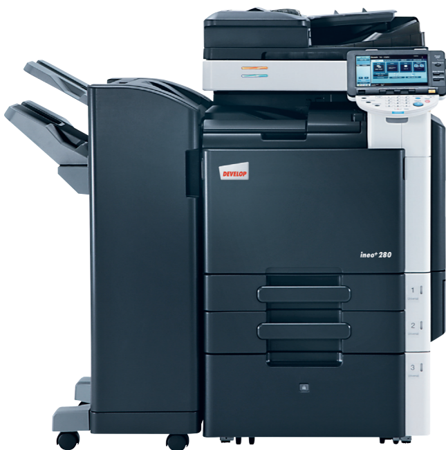
iNeo+ 280 с автоподатчиком (DF-617), напольным финишером (FS-627), активная тумба 2500 листов (PC-408)

Исследования показывают, что цветные документы притягивают взгляд. А это значит, что ваши рекламные буклеты, брошюры и баннеры станут привлекательнее.