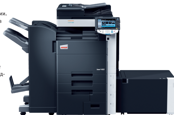
iNeo+ 452 со степлирующим финишером FS-527, устройством буклетирования SD-509 и боковым лотком большой емкости LU-204.

iNeo+ 452 исключительно удобен для работы – Вы оцените не только большой полноцветный сенсорный экран с интуитивно понятным интерфейсом, но и другие приятные «мелочи»: предпросмотр результата при использовании функций цифрового копирования (например, «водяных знаков»), постраничная настройка сохраненных документов, анимированные подсказки и помощь. Опциональная клавиатура сделает ввод текста (например, адресов электронной почты или заголовков файлов) еще более удобным.